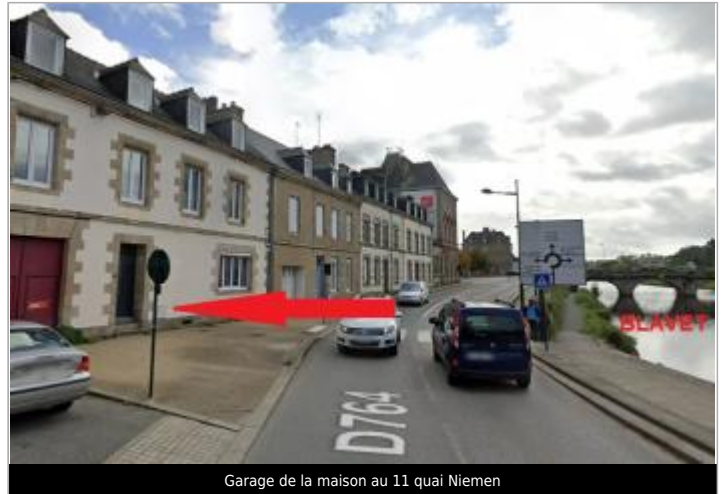
Garage de la maison au 11 quai Niemen