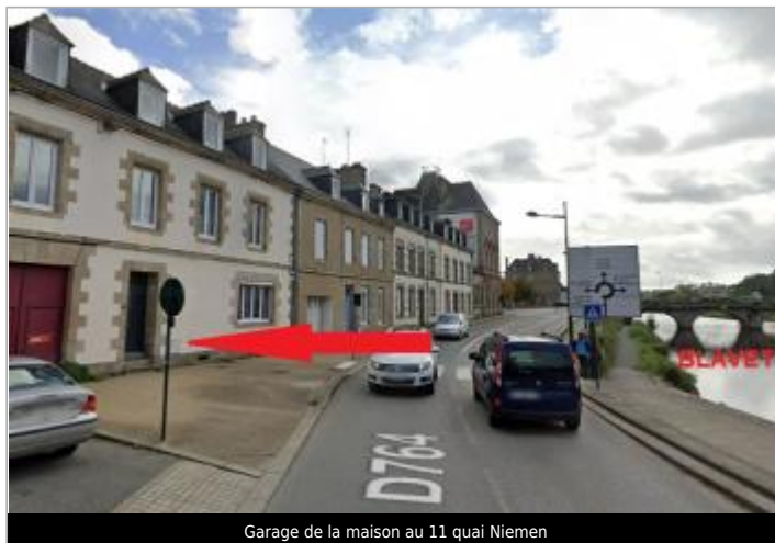
Garage de la maison au 11 quai Niemen

Coordonnées WGS84 : X: -2.96817526 / Y: 48.06648480