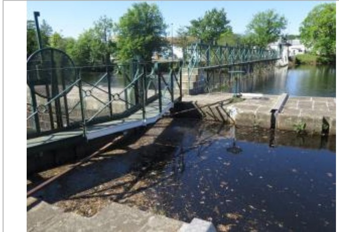
Amont de l'écluse de Lestitut à Pontivy