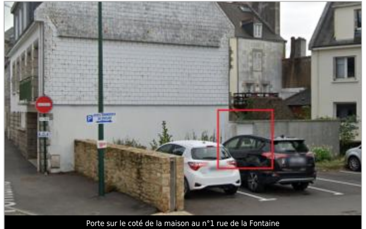
Porte sur le coté de la maison au n°1 rue de la Fontaine

Coordonnées WGS84 : X: -2.96872756 / Y: 48.06882830