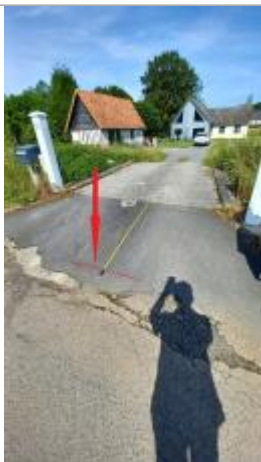
Vue de la distance de la laisse / seuil du portail.

Altitude calculée de l'eau (en m) : 40.295 m