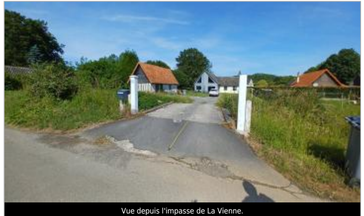
Vue depuis l'impasse de La Vienne.

Coordonnées WGS84 : X: 0.98882374 / Y: 49.81931100