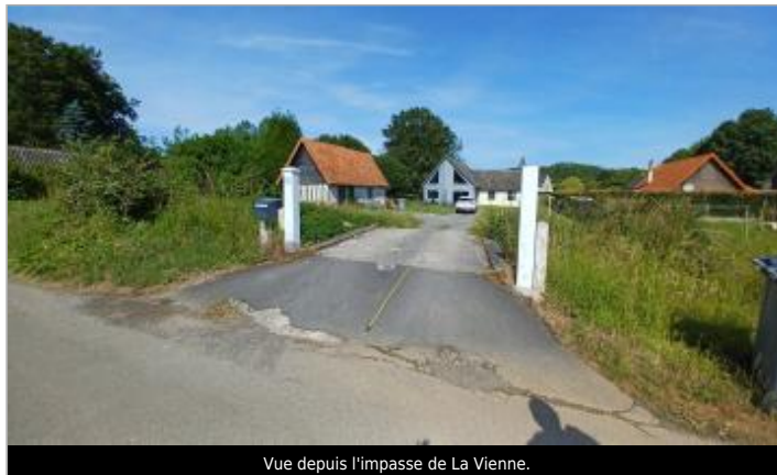
Vue depuis l'impasse de La Vienne.