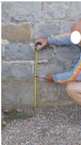
Laisse de crue à 30 cm/sol.

Altitude calculée de l'eau (en m) : 37.92