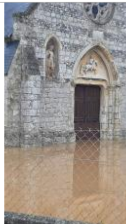
Vue de la crue.