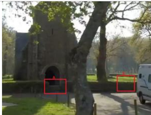
Entrée de la chapelle de Gohazé