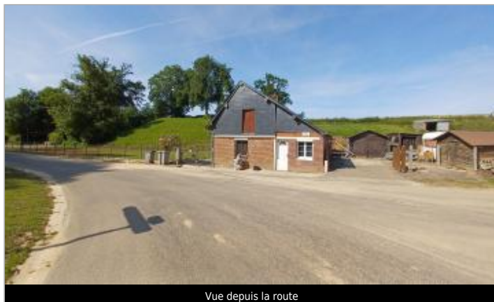
Vue depuis la route

Coordonnées WGS84 : X: 0.98490571 / Y: 49.81948230