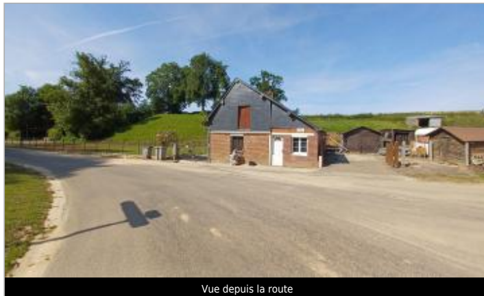
Vue depuis la route