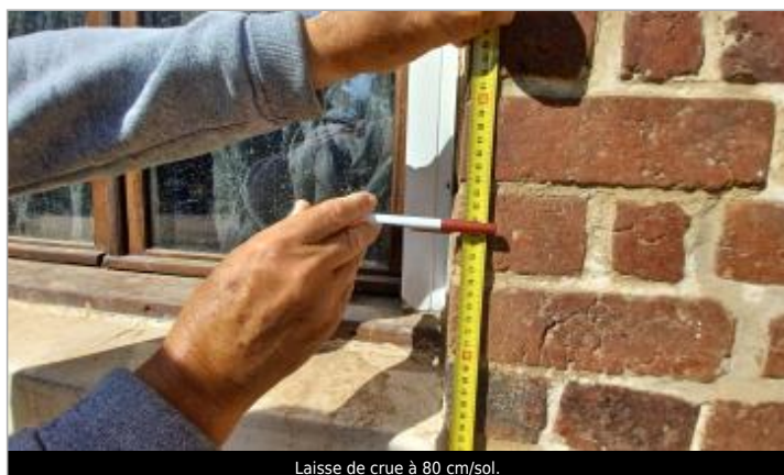
Laisse de crue à 80 cm/sol.