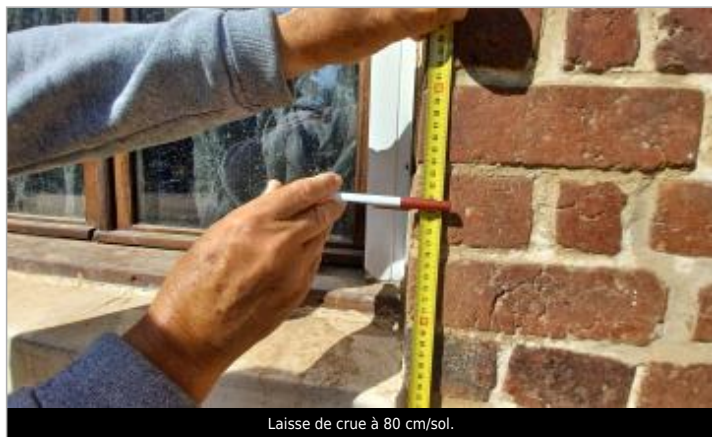
Laisse de crue à 80 cm/sol.

SOURCE DE REPÉRAGE : VISITE DE TERRAIN SPC SACN - 11/03/2020