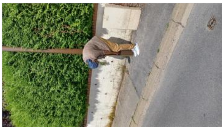
Laisse de crue à 46 cm/sol

SOURCE DE REPÉRAGE : VISITE DE TERRAIN SPC SACN - 11/03/2020