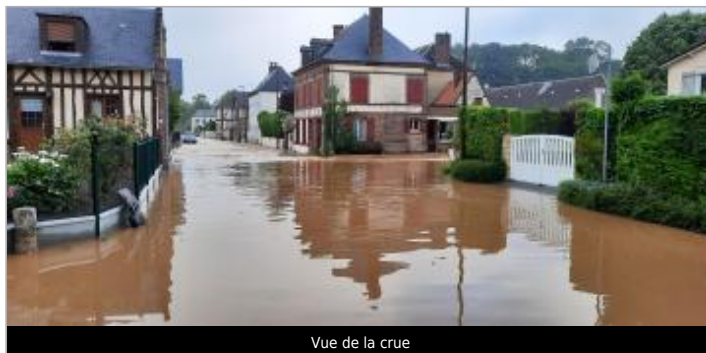
Vue de la crue