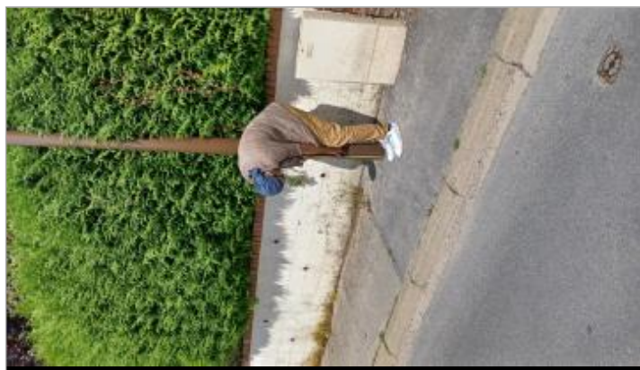
Laisse de crue à 46 cm/sol

SOURCE DE REPÉRAGE : VISITE DE TERRAIN SPC SACN - 11/03/2020