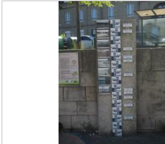
Totem quai Niemen devant la péniche de l'office de tourisme

Coordonnées WGS84 : X: -2.96842290 / Y: 48.06683840