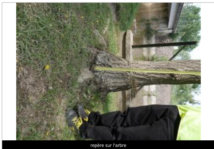
repère sur l'arbre

Altitude calculée de l'eau (en m) : 80.111 m