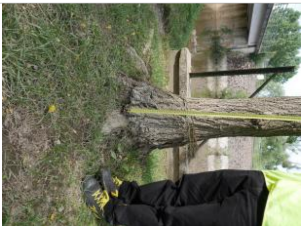
repère sur l'arbre

Altitude calculée de l'eau (en m) : 80.111