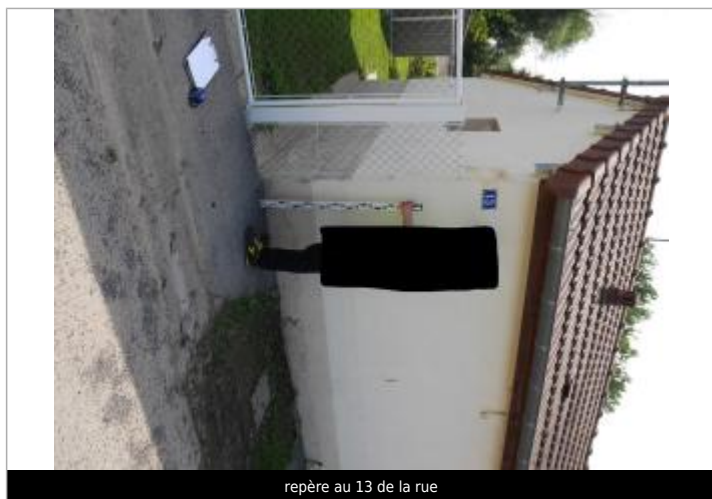
repère au 13 de la rue

Altitude calculée de l'eau (en m) : 82.54 m