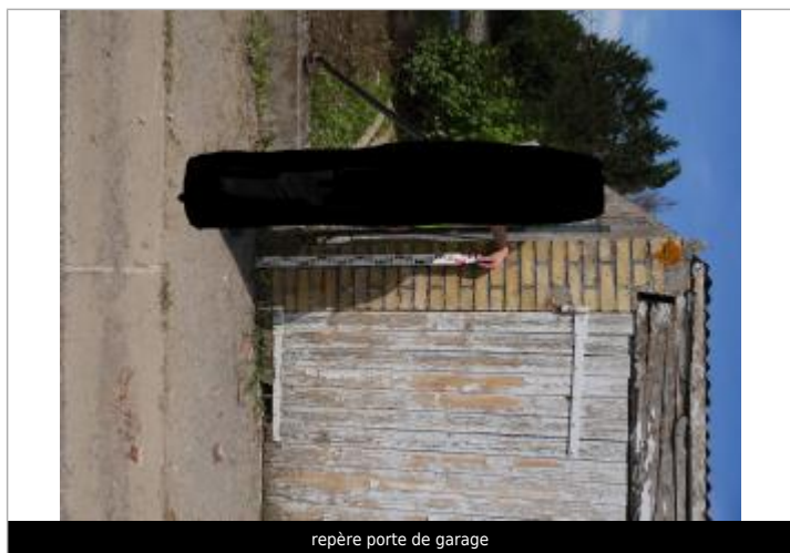
repère porte de garage