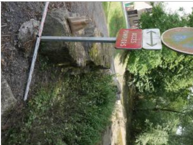
repère au panneau

Altitude calculée de l'eau (en m) : 82.269 m