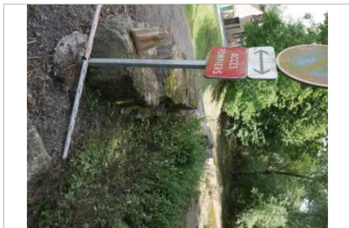
repère au panneau

Code : WEB_R_202306270812 Date de mise à jour : 27/06/2023 Auteur : SPC BN