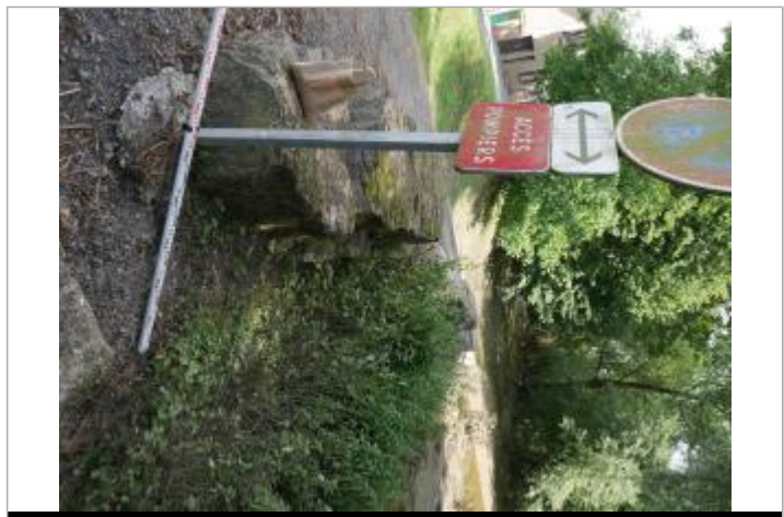
repère au panneau

GÉNÉRAL Code : WEB_R_202306270812 Date de mise à jour : 27/06/2023 Auteur : SPC BN