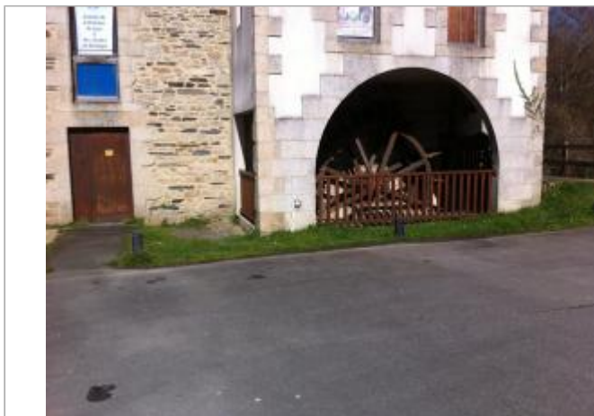
Moulin des Recollets

Coordonnées WGS84 : X: -2.96661560 / Y: 48.07133910