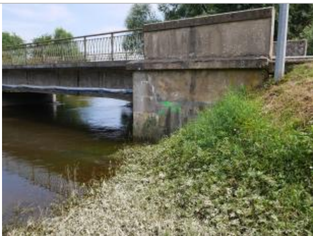
repère pont de voncq

Altitude calculée de l'eau (en m) : 87.86