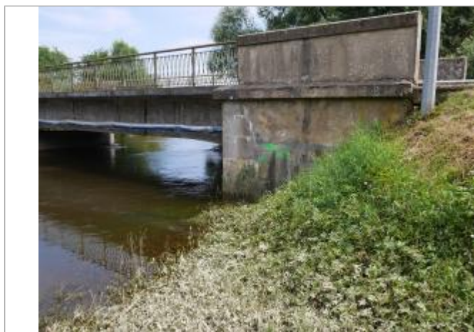
repère pont de voncq