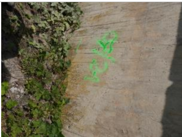
marque du repère

Altitude calculée de l'eau (en m) : 91.599 m