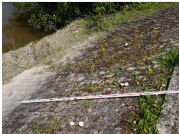
marque sur la berge

Altitude calculée de l'eau (en m) : 93.86 m