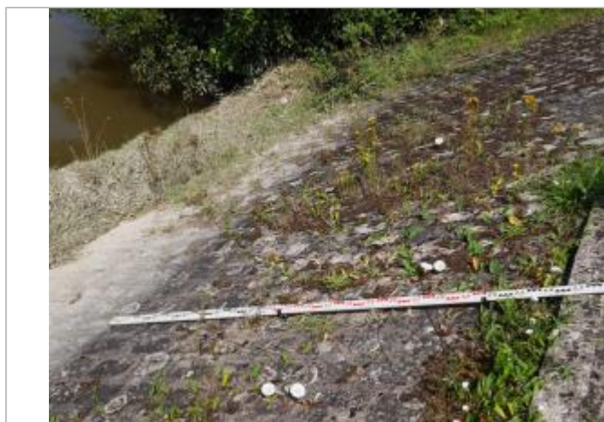
marque sur la berge

Altitude calculée de l'eau (en m) : 93.86 m