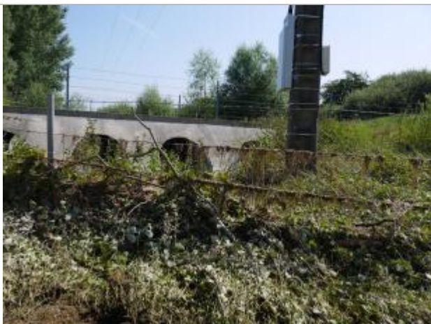
laisses de crue sur les barbelés

Altitude calculée de l'eau (en m) : 96.786 m