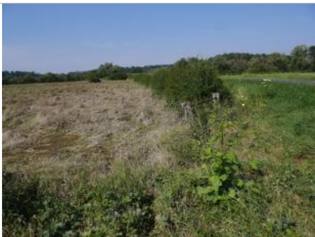
barrière avec repère sur le poteau de droite

Altitude calculée de l'eau (en m) : 98.326 m