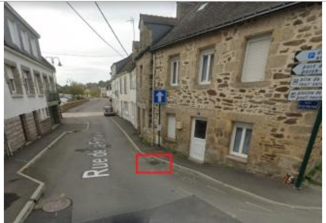
Grille eaux pluviales devant le n°2 rue de la Fontaine