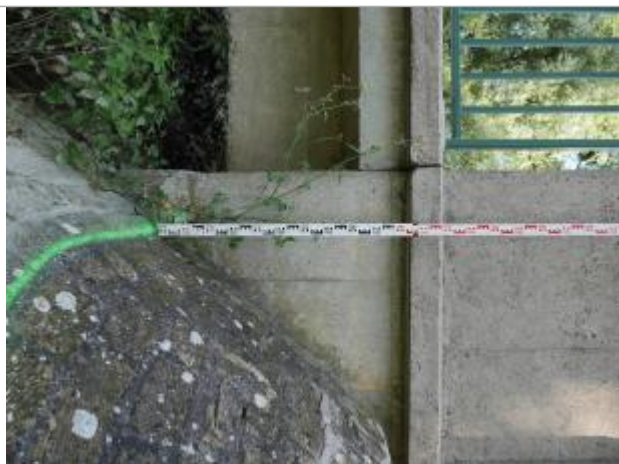
repère pont d'Olizy

Altitude calculée de l'eau (en m) : 100.74