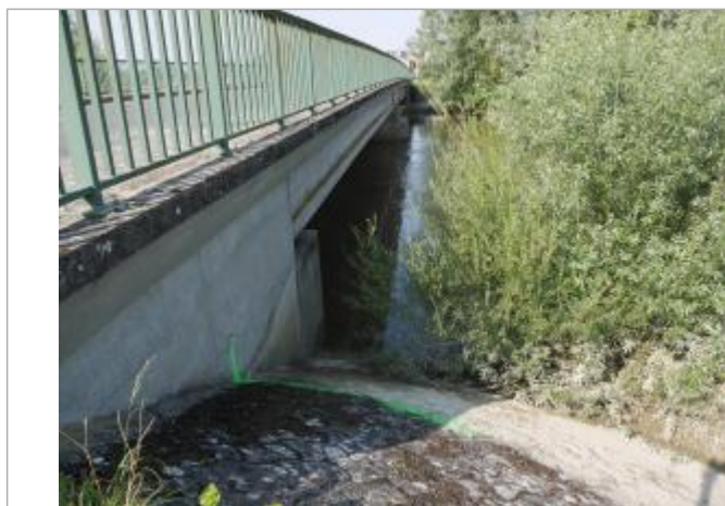
repère aval pont de Brecy