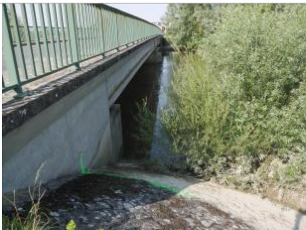
repère aval pont de Brecy

Altitude calculée de l'eau (en m) : 101.763