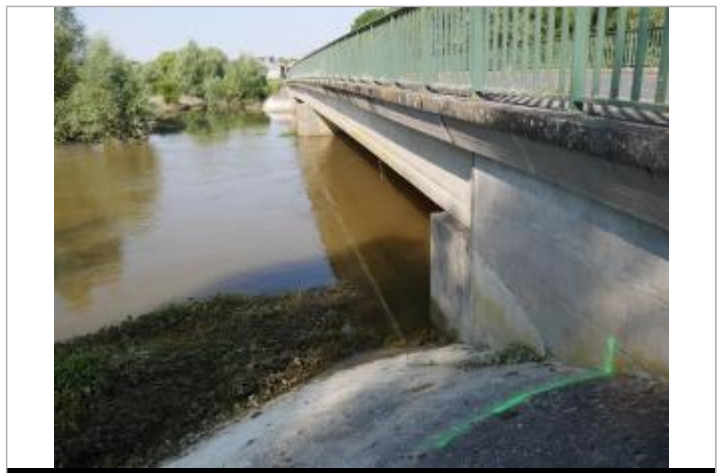
Repère en amont rive droite

GÉNÉRAL Code : WEB_R_202306261012 Date de mise à jour : 26/06/2023 Auteur : SPC BN