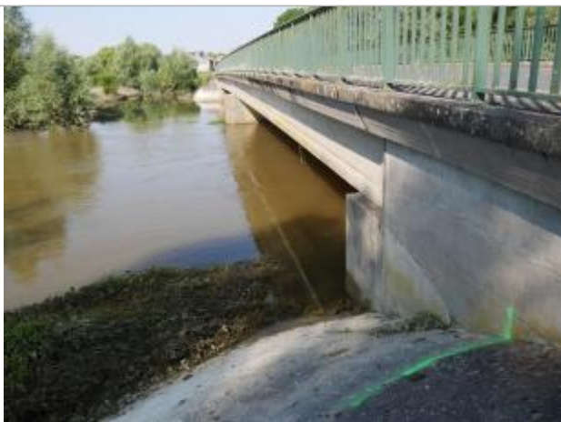
Repère en amont rive droite

Altitude calculée de l'eau (en m) : 101.868