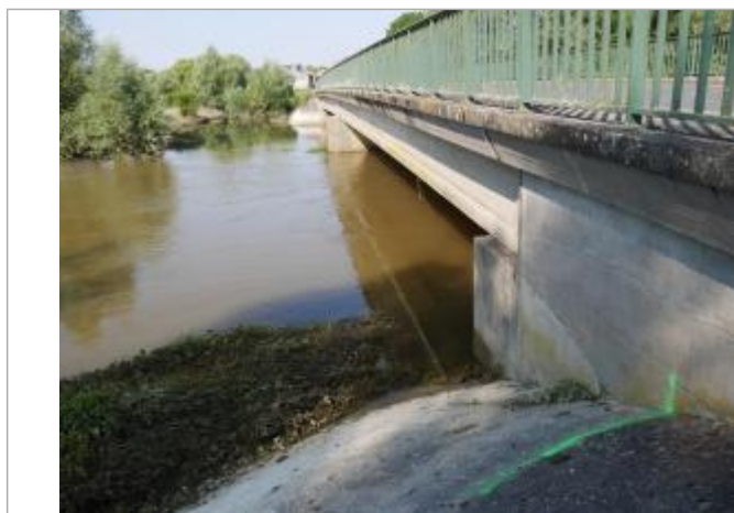
Repère en amont rive droite

Altitude calculée de l'eau (en m) : 101.868