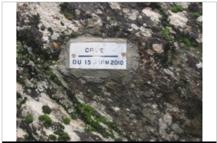
Vue rapprochée du repère, auteur: Cerema, 2014

MARQUE Texte : CRUE DU 15 JUIN 2010 Maximum de l'inondation : Oui Pérennité : Longue État du repère : Bon