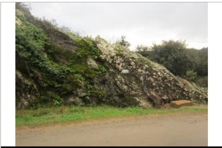
Vue du site, auteur: Cerema, 2014

GÉOLOCALISATION Coordonnées WGS84 : X: 6.51152170 / Y: 43.43537490 Coordonnées RGF93 (Lambert 93) X: 984342.49 / Y: 6265908.77 Coordonnées RGF93 (ETRS89) : X: 6.5115217 / Y: 43.4353749 Code Hydro: Y5--0200 Rive de référence: Non renseigné