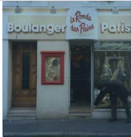
Croquis de repérage