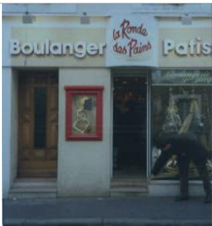
Photo de la laisse provenant du carnet de laisses de crue établi pour le PPRI de La Flèche approuvé en 1998.