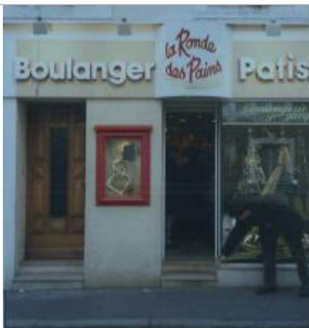
Photo de la laisse provenant du carnet de laisses de crue établi pour le PPRI de La Flèche approuvé en 1998.