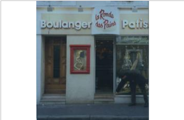
Croquis de repérage