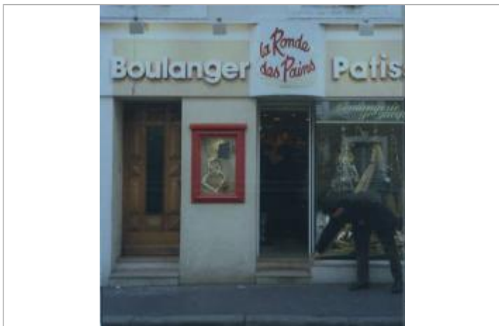
Photo de la laisse provenant du carnet de laisses de crue établi pour le PPRI de La Flèche approuvé en 1998.