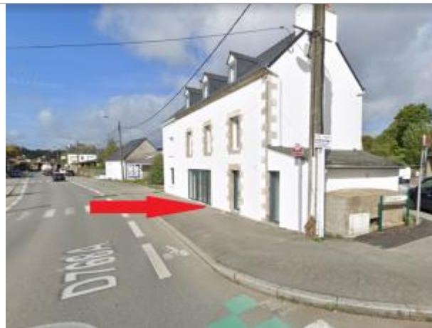
Bâtiment au 14 rue Albert de Mun

Coordonnées WGS84 : X: -2.96401436 / Y: 48.05782540