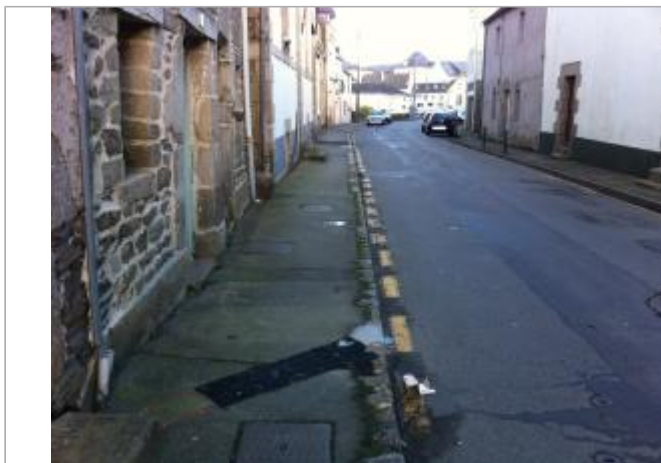
Trottoir 42 RUE DES MOULINS

Coordonnées WGS84 : X: -2.96983400 / Y: 48.06975920