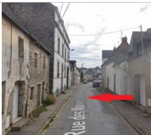
Limite de l'inondation au 22-42 rue des Moulins

Altitude calculée de l'eau (en m) : 56.34 m