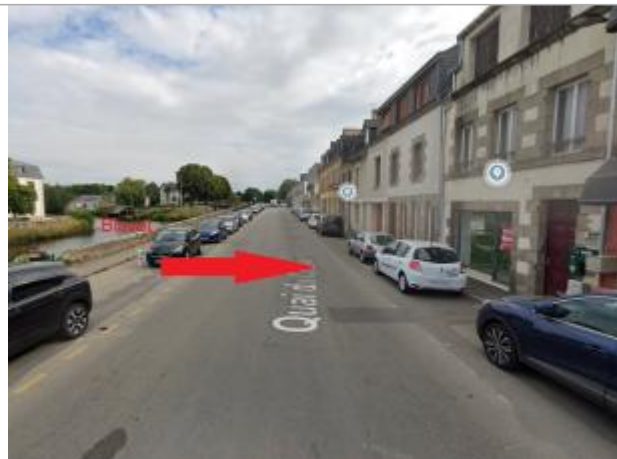
Chaussée devant le 15 quai du couvent