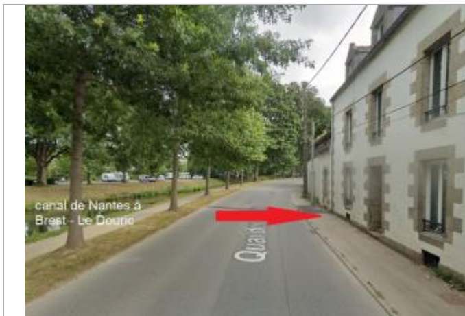
Chaussée devant le 45 quai des Recollets