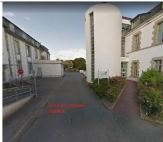
Cour de l'ancien hôpital