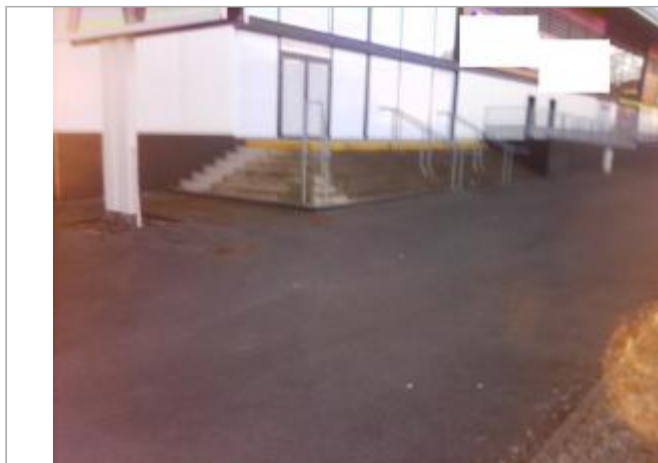
Devanture du bâtiment de commerce

Coordonnées WGS84 : X: -2.96031100 / Y: 48.05499630