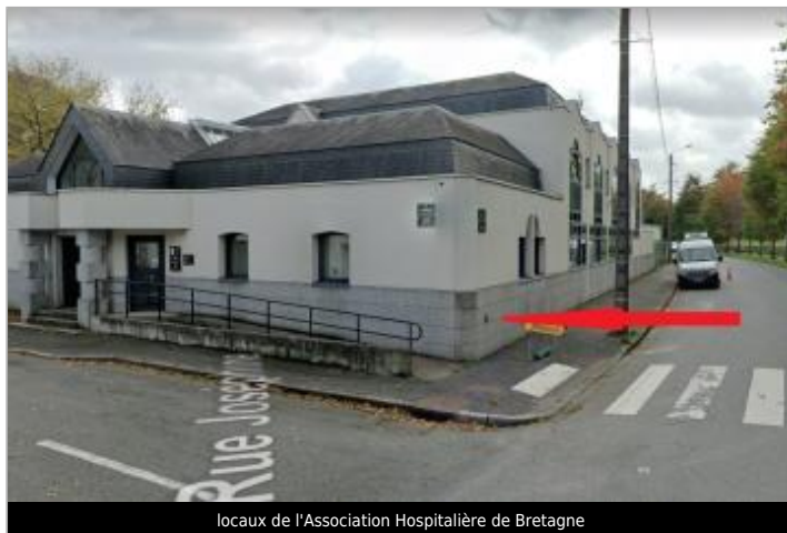
locaux de l'Association Hospitalière de Bretagne

Coordonnées WGS84 : X: -2.96985860 / Y: 48.06146140