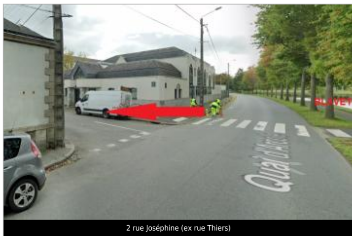
2 rue Joséphine (ex rue Thiers)