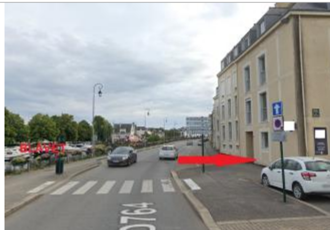
Bâtiment au 17 quai Presbourg