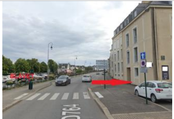
Bâtiment au 17 quai Presbourg

Coordonnées WGS84 : X: -2.96836974 / Y: 48.06761900