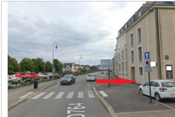
Bâtiment au 17 quai Presbourg