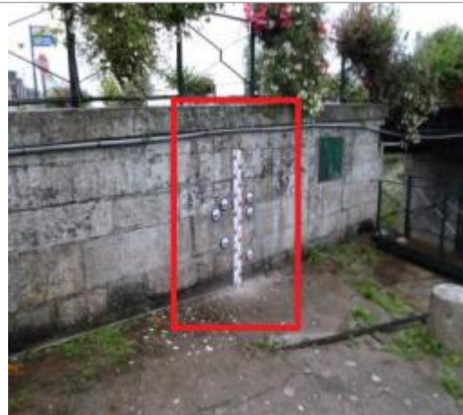
Mur amont du pont des Recollets coté écluse