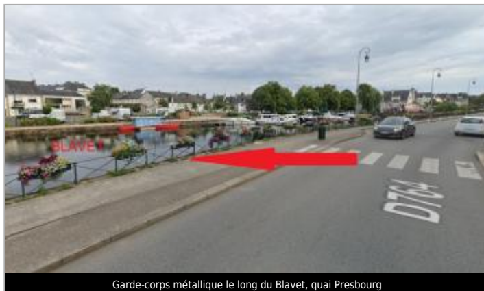
Garde-corps métallique le long du Blavet, quai Presbourg