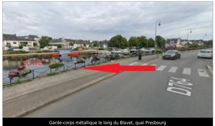
Garde-corps métallique le long du Blavet, quai Presbourg