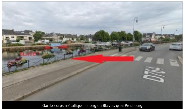
Garde-corps métallique le long du Blavet, quai Presbourg