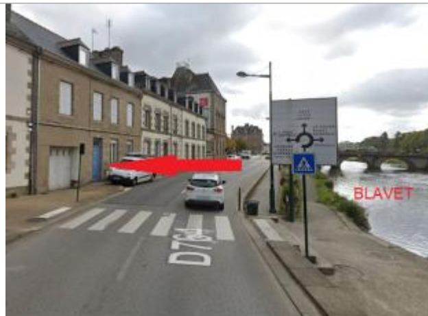
Garage au n°13 quai Niemen