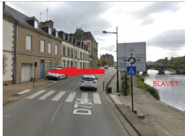
Garage au n°13 quai Niemen

Coordonnées WGS84 : X: -2.96818895 / Y: 48.06637600