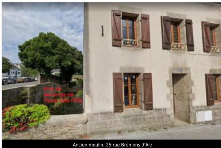
Ancien moulin, 25 rue Brémons d'Arz