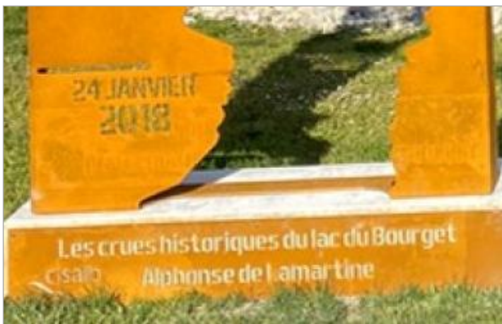
Repère de crue 24 janvier 2018