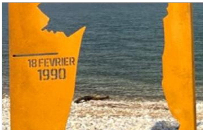
Repère de crue 17 février 1990