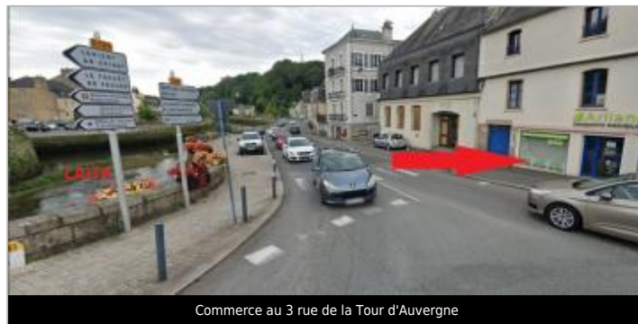
Commerce au 3 rue de la Tour d'Auvergne

GÉOLOCALISATION Coordonnées WGS84 : X: -3.54568222 / Y: 47.87134420 Coordonnées RGF93 (Lambert 93) X: 211200.9 / Y: 6772599.14 Coordonnées RGF93 (ETRS89) : X: -3.5456822 / Y: 47.8713442 Code Hydro: J48-0300 Rive de référence: Droite