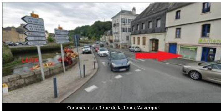
Commerce au 3 rue de la Tour d'Auvergne